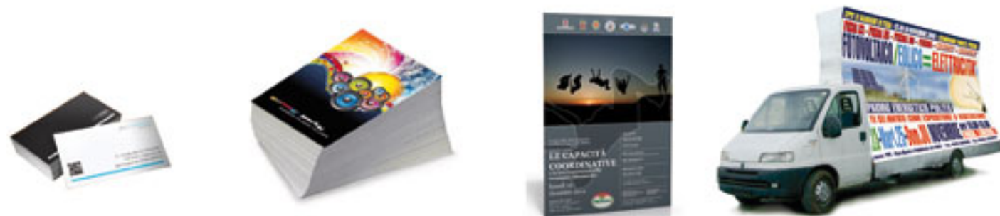
Biglietti da visita