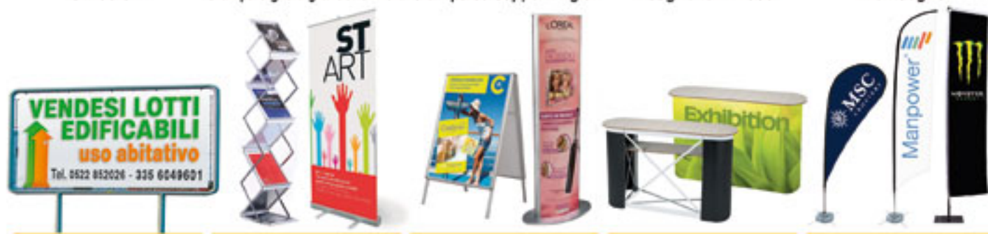
Cartelli stradali Portadepliant - Rollup Espositori - Totem Desk fieristici Bandiere con supporto