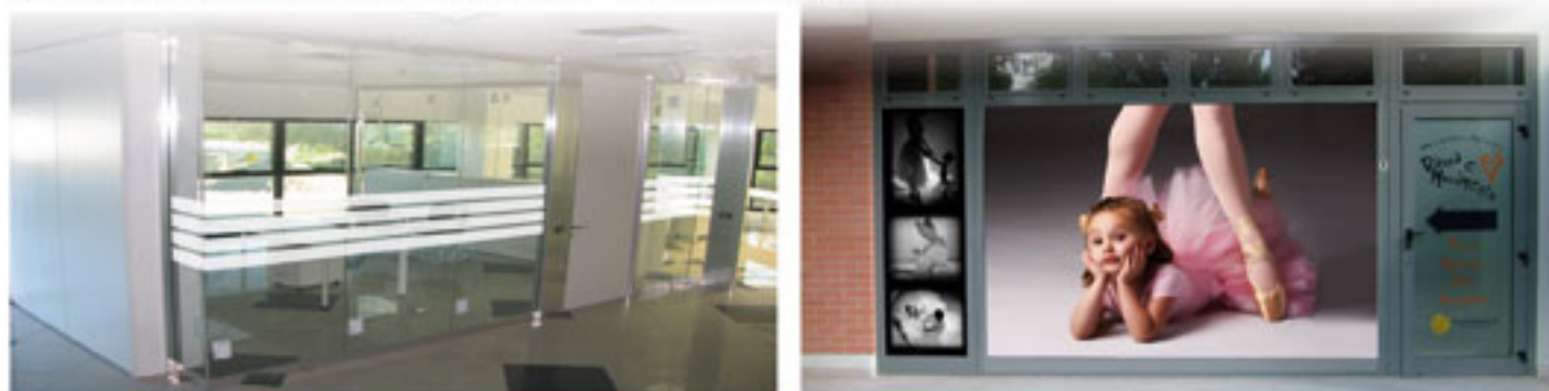
Grafiche vetrate uffici