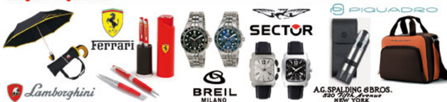
Regalistica aziendale - Grandi marchi