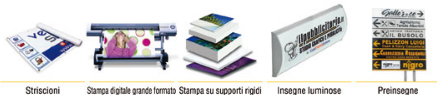
Striscioni Stampa digitale grande formato Stampa su supporti rigidi Insegne luminose Preinsegne