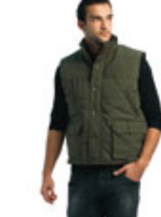
Gilet multitasche imbottito