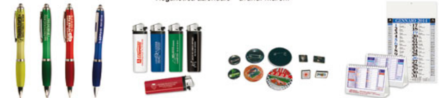
Penne Accendini Spille - Pin Calendari