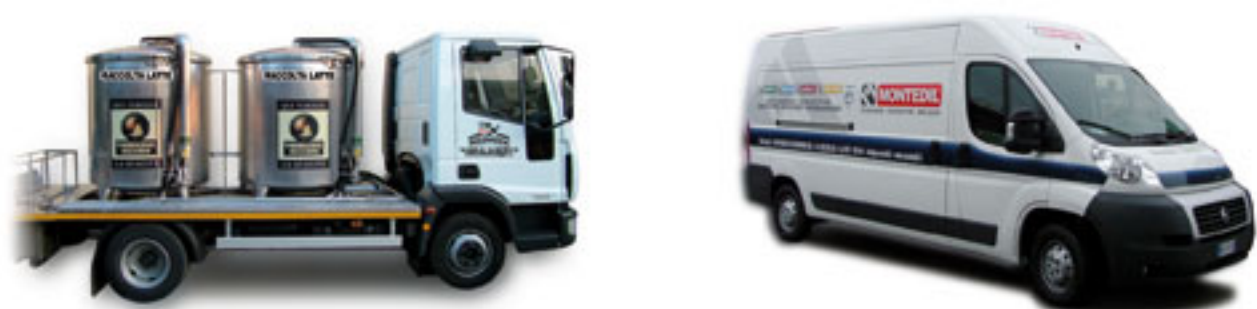
Personalizzazione mezzi industriali, agricoli e d'opera